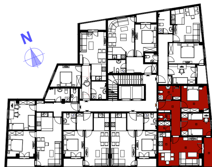
POZICIJA STANA NA ETAŽI