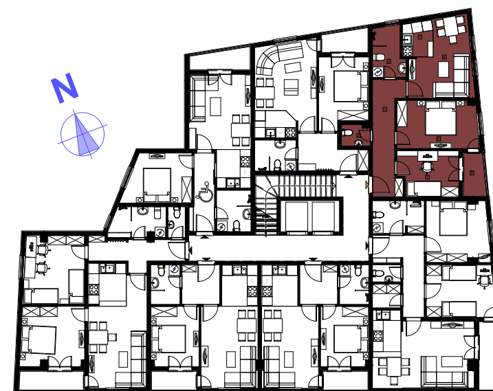
POZICIJA STANA NA ETAŽI